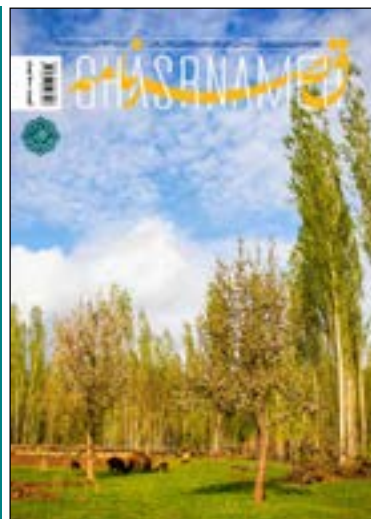
روستای مارشک مشهد